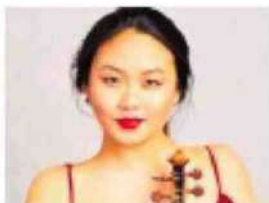
VIOLINISTA Stella Chen

■ Prosegue il «Festival del talento straordinario», ossia il Nume Academy & Festival di Cortona che si chiuderà 12 giugno. Il Nume Academy & Festival è una nuova idea di festival dove conoscere da vicino i grandi artisti e le nuove generazioni in anteprima. Non solo ospita grandi nomi già affermati del panorama internazionale come il celebre Quartetto Belcea, il violoncellista Alban Gerhardt e la violinista Stella Chen, ma porta in Italia la meglio gioventù della musica classica. Nume Festival dà spazio alle nuove generazioni e promuove concretamente i giovani talenti anche dopo la loro partecipazione ai corsi. Tra loro la violista Emma Wernig e il violinista Hans Christian Aavik (edizione 2021) recente vincitore del concorso internazionale Carl Nielsen. Un progetto unico in Italia, per sostenere le carriere dei giovani più meritevoli.