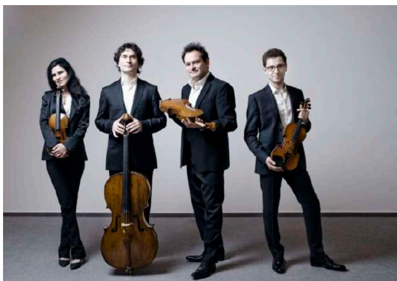
Belcea Quartet