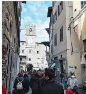
Cortona Sarà una stagione turistica intensa